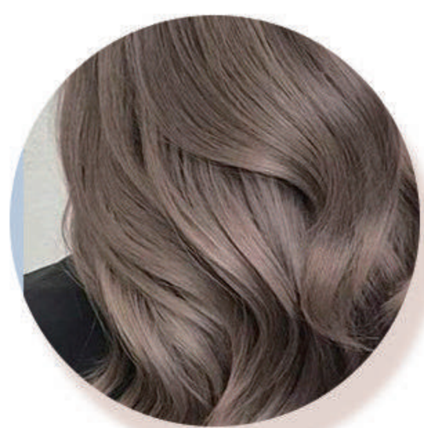
护发 洗发水、护发素、发膜等