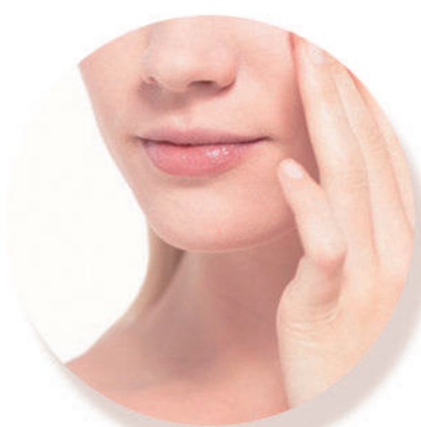
护肤 保湿水、乳液、面霜、精华等