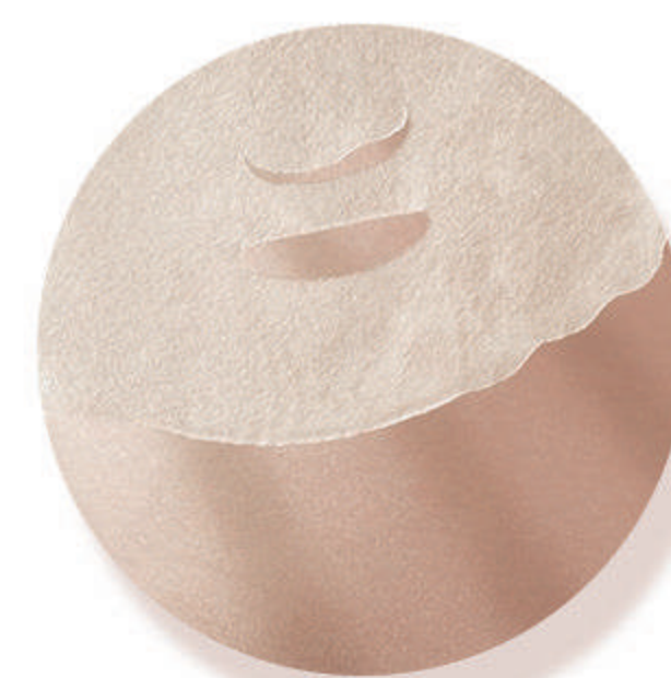
外用医疗器械 冷敷贴、保湿贴等