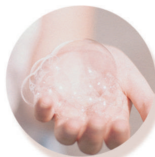
洗护 洗面奶、卸妆产品等